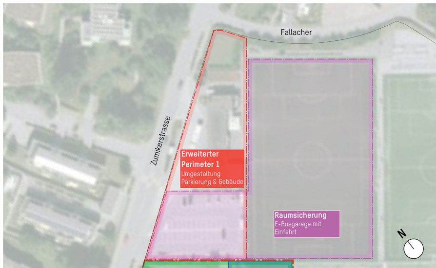
Abb. 3: Flächenzuordnung innerhalb des Bereichs Nord.

Busgarage mit Einfahrt» bezeichnet. Sofern baulich realisierbar, könnte eine E-Busgarage unterhalb des Fußballplatzes erstellt werden. Der Teilbereich «Nord» gilt als «Möglichkeitenperimeter» und soll bei der Wettbewerbsdurchführung auf konzeptioneller Ebene berücksichtigt werden. Konkrete planerische Entwürfe für eine allfällige E-Busgarage sind hingegen nicht Bestandteil dieses Wettbewerbs.