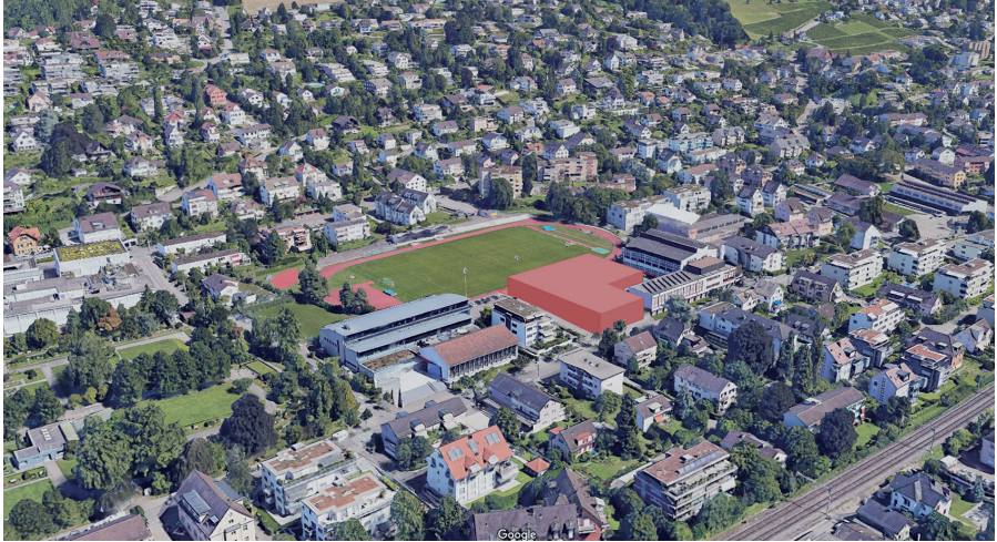
Abb. 4: Skizzenhafte Darstellung Dreifachturnhalle auf dem Areal Heslibach mit Ansicht aus Nordwesten.

verschoben werden, da diese Flächen beansprucht werden. Da es sich beim Hallenbad und der Doppelturnhalle Heslibach um kommunale Inventarobjekte handelt, ist der Neubau einer Dreifachturnhalle gestalterisch sorgfältig bei den Bestandesbauten einzuordnen.