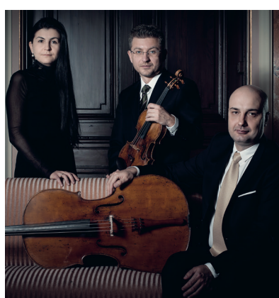
Spyros Piano Trio