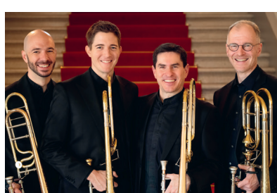
Die Posaunen der Oper Zürich

Das Atalanta Ensemble vereint die junge Kammermusikszene der Schweiz. Es nimmt uns mit auf eine Reise durch die verschiedensten Gefühlswelten. Beethoven entfaltet sich mit dramatischer Kraft und stürmischer Energie, während Britten mit fantasievollen und lyrischen Klängen eine traumhafte Atmosphäre schafft. Brahms rundet das Programm mit einer Wärme und sinfonischen Tiefe ab, die von purer Lebensfreude und Erfüllung durchzogen ist.