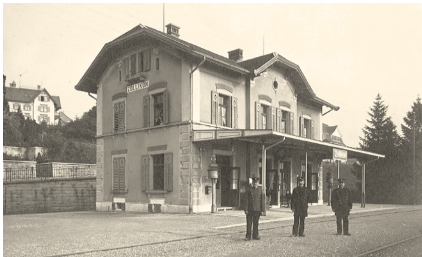
Bahnhof Zollikon um 1920