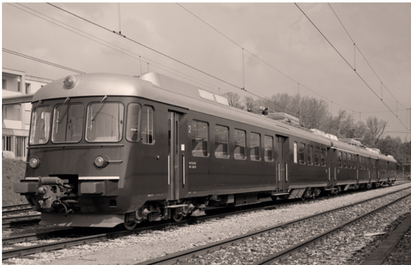
Der Goldküstenexpress im Jahr 1965