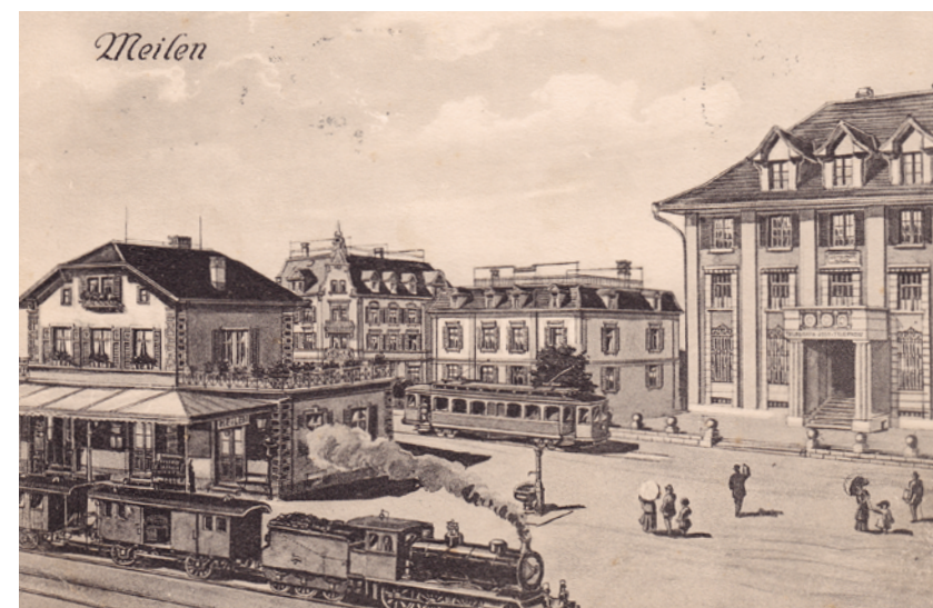
Der Bahnhof von Meilen um 1915.

Quellen: «Aus den Annalen der Rechtsufrigen», Werner Neuhaus und Herrliberger Kalender 1994, H. R. Weinmann.