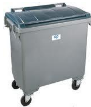
Kunststoffcontainer 770-Liter Kunststoff (nicht grün), ~ 12 Abfallsäcke zu 35 Liter

Bei Einfamilienhäusern und kleineren Liegenschaften empfehlen wir einen gemeinsamen Container. Wenn der Standort nicht so gewählt werden kann, dass der Container vom Sammelfahrzeug aus gesehen wird, hat die Bereitstellung wie bisher am Sammeltag bis 7 Uhr zu erfolgen.