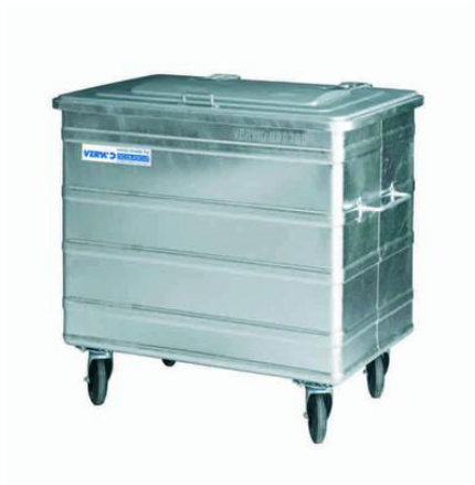
Stahlcontainer, 800 Liter Inhalt ~ 12 Abfallsäcke zu 35 Liter